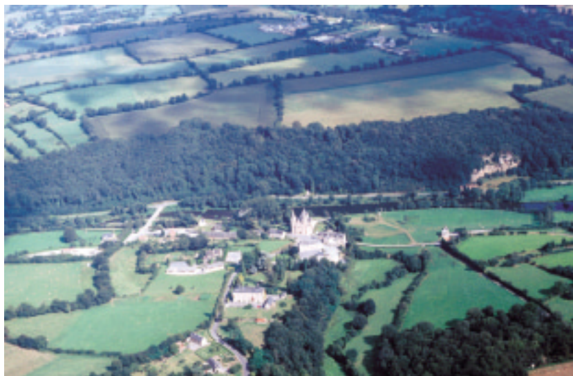
Ci-dessus : La Chapelle-sur-Vire à Domjean.

Plus au nord, la Vire s'enfonce dans un nouvel affleurement des poudingues violacés du Cambrien, bien visibles dans la carrière de Troisgots. D'abord rectiligne, étroite, aux versants abrupts, hauts de 60 mètres comme des murs boisés en grande partie, la vallée abrite le centre de pèlerinage de La Chapelle-sur-Vire. Puis, les deux grands méandres du Ham, profonds de 200 mètres, opposent la demi-circonférence d'un dessin raide, subverticale et boisée de la rive concave aux pentes douces et cultivées en grandes parcelles encloses de la rive convexe. Les bâtiments anciens de la région ont utilisé, en pierres de taille, le poudingue de Troisgots, pour créer d'heureux jeux de couleur avec les schistes.