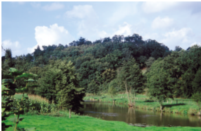
Ci-dessus : La vallée vers Pont-Farcy.

De Pont-Farcy à Tessy-sur-Vire, la rivière coupe transversalement le synclinal bocain, ses crêtes et ses vallées orientées nord/est sud/ouest. Aussi le profil des sommets encadrants n'est plus de hauteur continue mais indenté. La vallée perd son aspect de gorge étroite, même si certains versants sont très redressés ou entaillés de carrières. Le ruban d'eau s'écoule au milieu d'un fond de prairie suivi d'alignements d'arbres. Le caractère original devient la variété des grands versants, habillés de bocage et parfois de bois, et donc des vues successives.