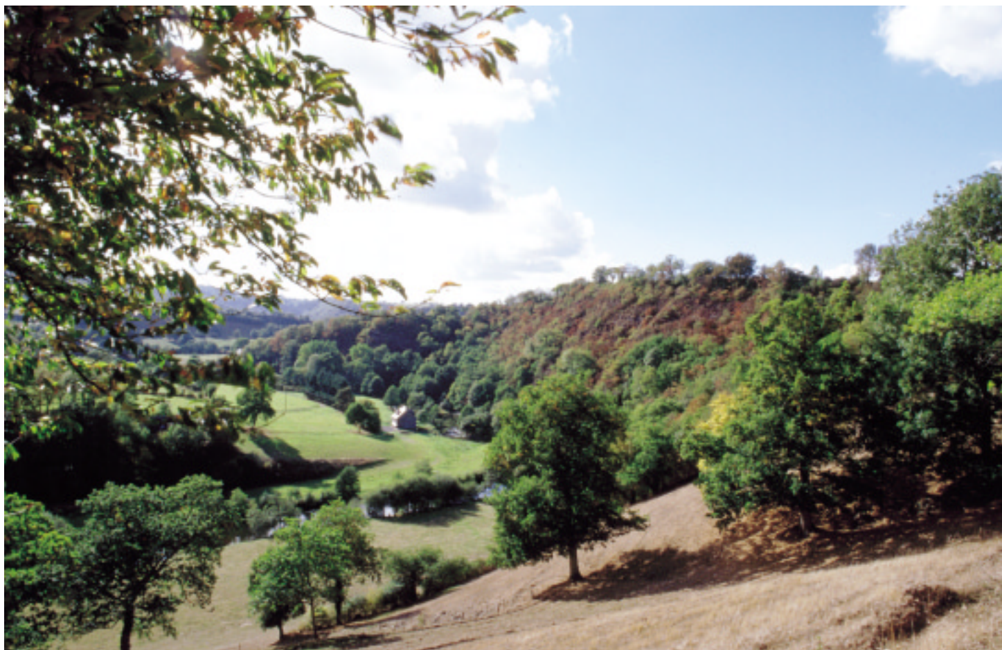
Ci-dessus : La vallée de la Vire à Campeaux.