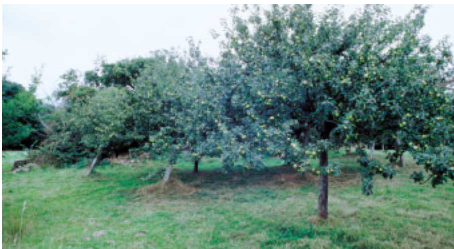
Ci-contre : Les vergers de pommiers au Mesnil-au-Val.