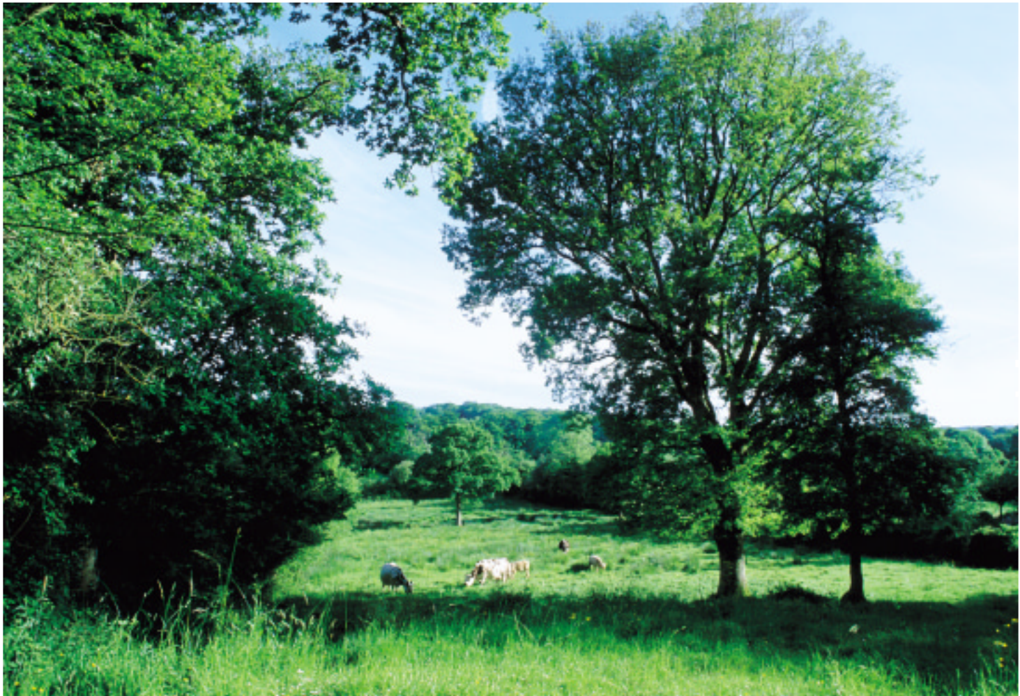
Ci-dessus : La vallée de la Saire à Brillevast.