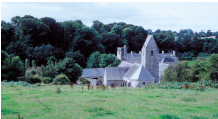
Ci-contre : Le bourg de Gonnevillle.