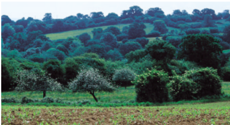
Ci-contre : Bocage dense et vergers de pommiers.

Dans la partie sud, les boisements, moins denses, cèdent progressivement la place à un bocage à pommiers et poiriers, qui compose un paysage moins touffu.