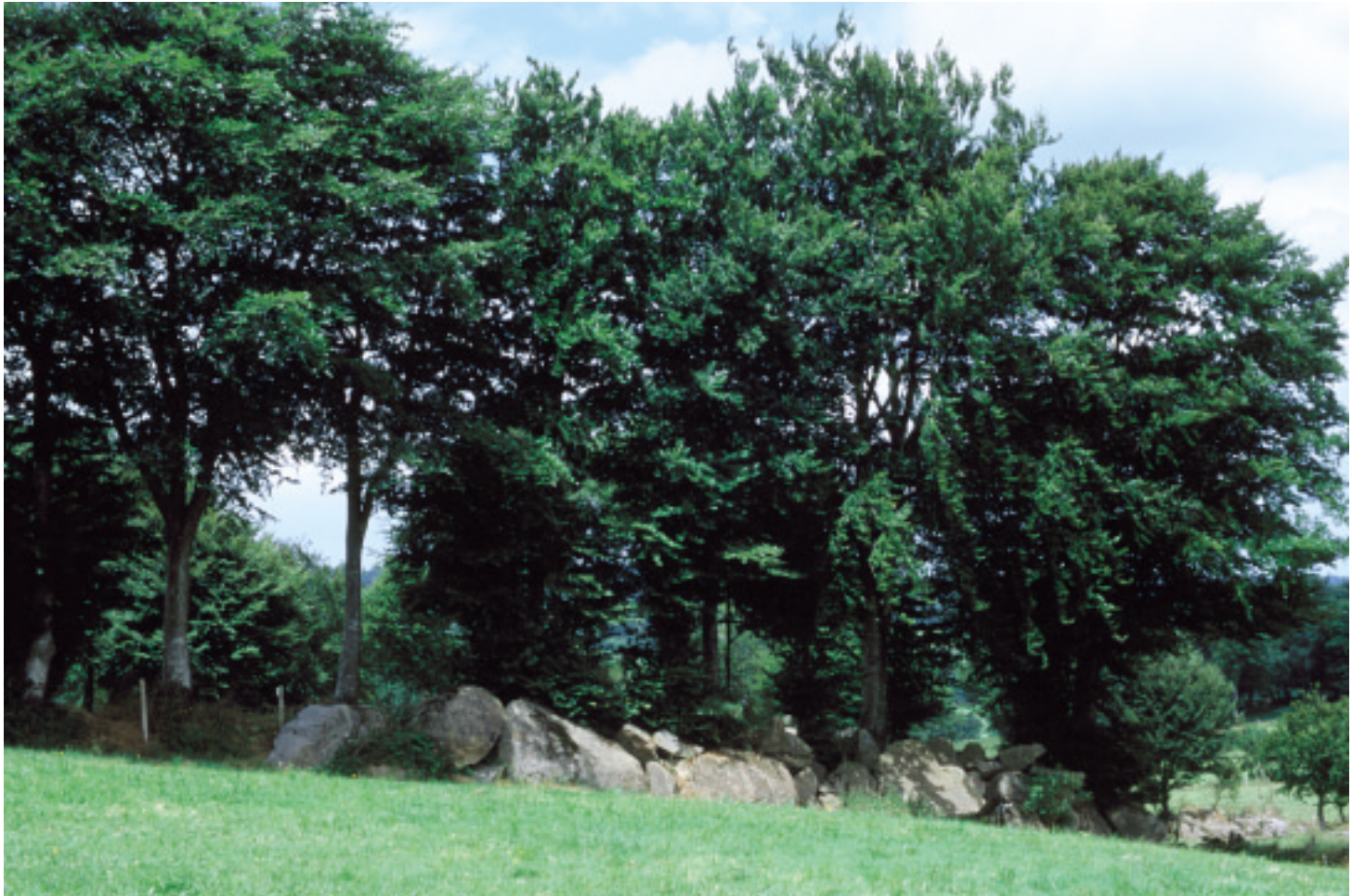
Ci-dessus : Haie de hêtres à Gathemo.