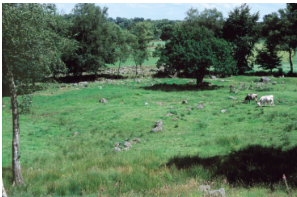
Ci-contre : Affleurements de granite à Champ-du-Boult.

Entre Saint-Sever et la vallée de la Sée, de hautes terres portent des forêts et un bocage arboré. La régression des haies ouvre le paysage vers les lointains, que ponctuent les hêtres.