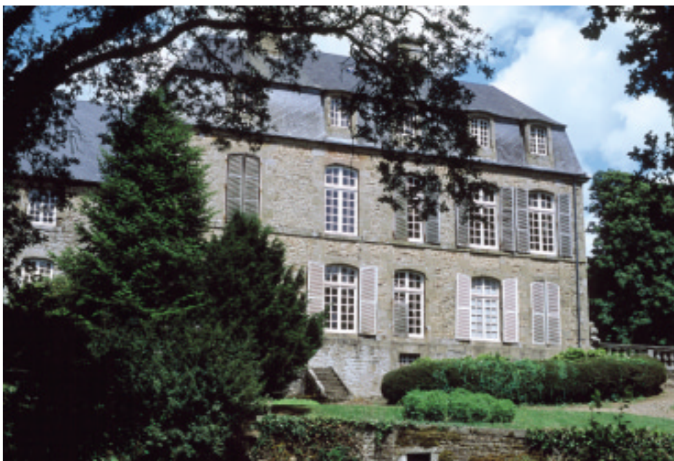
Ci-contre : Château à Saint-Pois.

L e développement des labours de maïs-fourrage n'a entraîné que peu d'arasement de haies, mais les labours plus profonds qu'autrefois ont nécessité un épierrement de gros blocs de granite qu'on empile le long des talus. L'association surprenante d'une absence d'entretien des talus et d'un renouvellement des haies par la réservation de baliveaux de hêtres fragilise ces arbres qui souffriront du manque de terre arable. On peut aussi s'interroger sur le caractère éphémère des talus-dentelles.