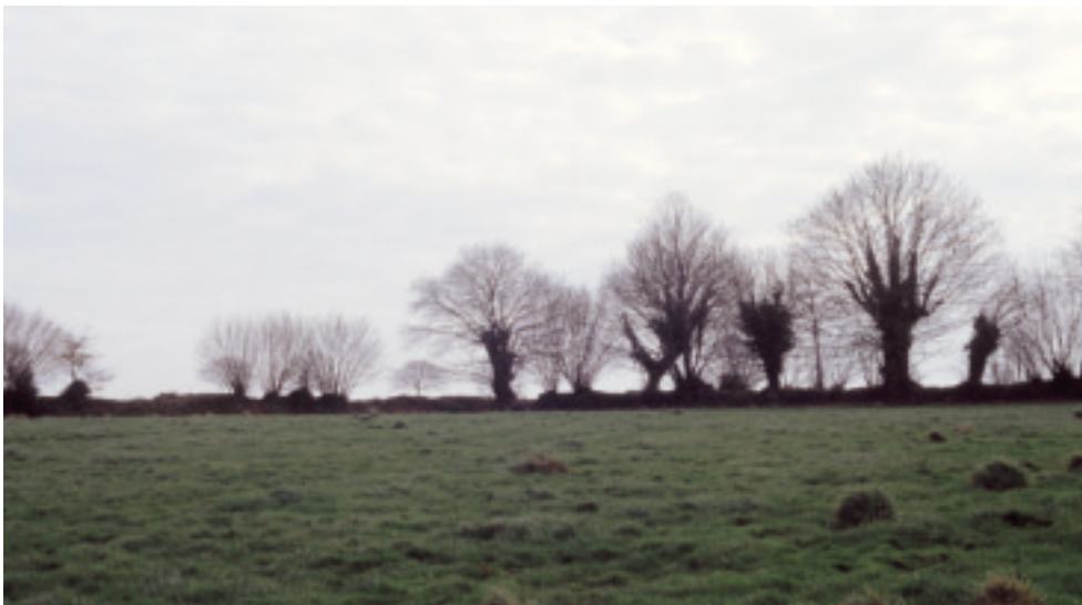
Ci-contre : Contre-jour sur de vieux arbres.

La disparition, faute d'entretien et de possibilités d'utilisation des anciens bâtiments agricoles en pan de bois, retirerait un caractère architectural original et une des seules touches de couleur vive de ce paysage. Les pavillons neufs à enduit clair, qui se multiplient autour de Saint-Hilaire, d'Isigny-le-Buat, de Mortain et de l'usine de Romagny, n'apportent que des teintes banales.