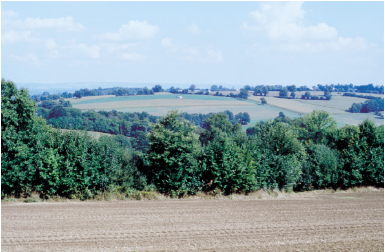
Ci-dessus : Le bocage transparent à Saint-Brice-de-Landelles.