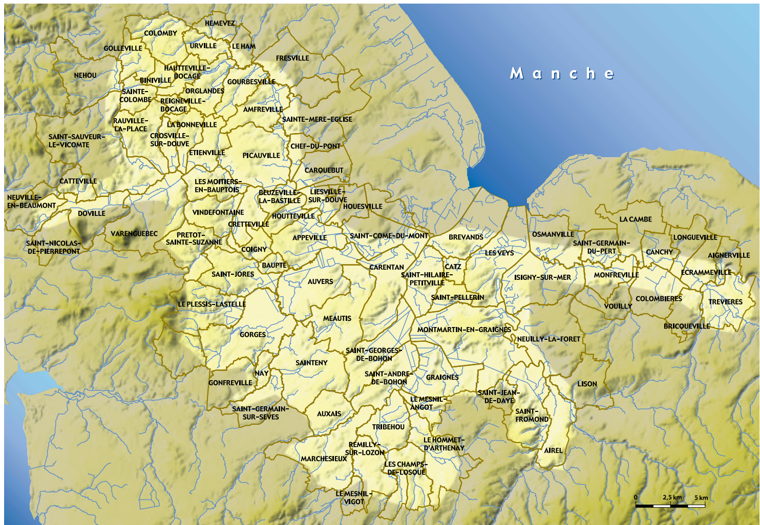
Ci-dessus : Les marais du Cotentin et du Bessin.