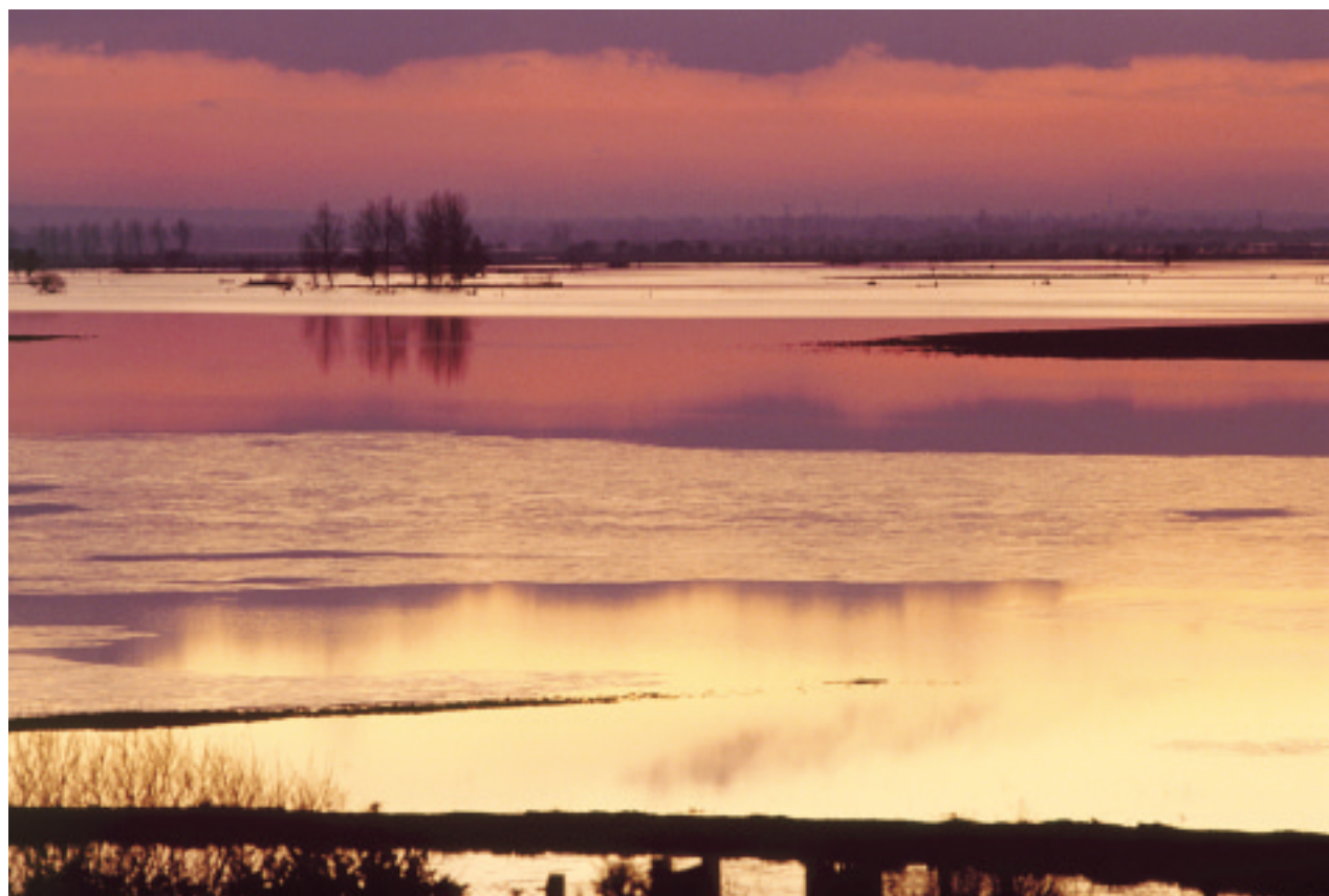
Ci-dessus : Graignes, contrejour sur le marais inondé.