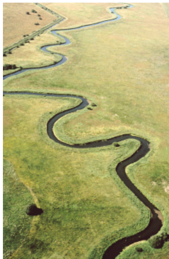
Ci-contre : Cours sinueux d'une rivière sur le marais.