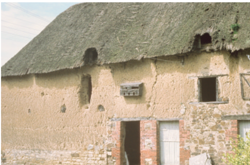
Ci-contre : Maison traditionnelle des marais : murs en terre (la masse) et couverture en roseaux.

Les maisons de terre, sources des rares taches colorées de ces paysages, à défaut d'être reproduites, méritent leur entretien.