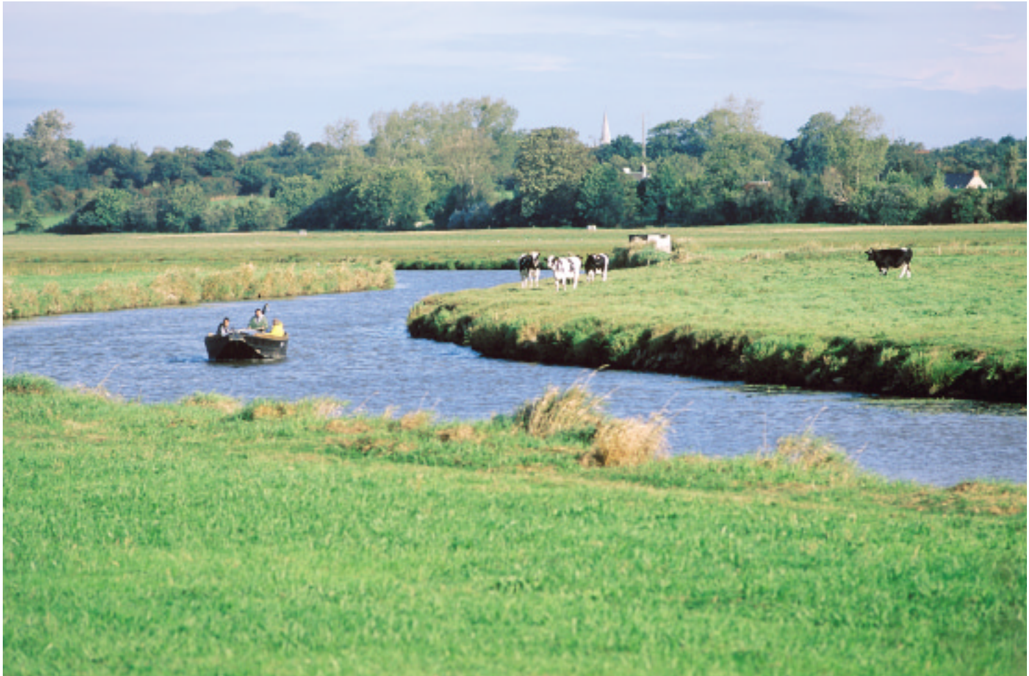
Ci-dessus : Les marais du Cotentin en été.