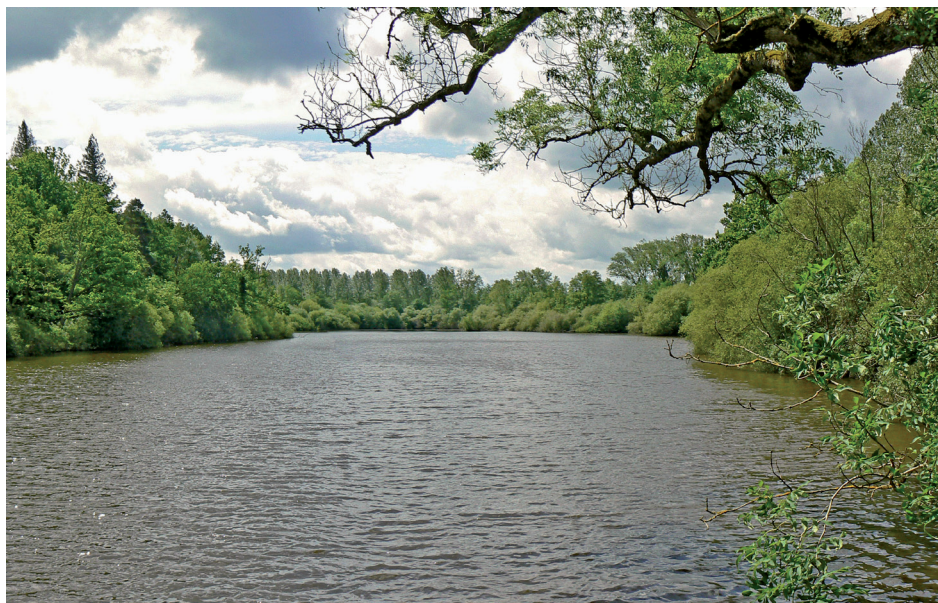
L'étang supérieur vu de la digue-route

La commune de Montmerrei (où se trouve principalement le site) se situe à 13 km au sud d'Argentan et à 11 km au nord-ouest de Sées. Le domaine de Blanchelande se trouve au sud du bourg, sur la D 222 vers la forêt d'Ecoves.