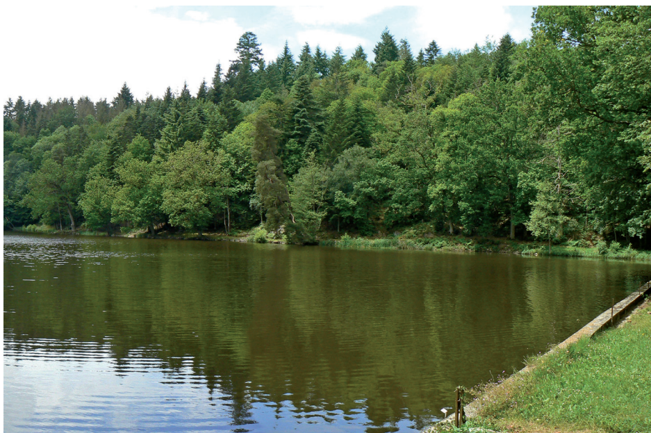
La rive ouest de l'étang du milieu

En quittant le village du Cercueil, la route départementale 222 suit le cours de la rivière et l'accompagne dans sa traversée des collines. A l'ouest de la route, l'étang supérieur ne se devine guère, masqué par une végétation dense de feuillus. Il se découvre depuis la digue-route menant à la Grande Forge, bordé par la végétation de ses rives : frênes, chênes, hêtres, érables et saules. Vers le sud du site, des prairies couvrent les pentes les moins abruptes, tandis qu'à l'est, au-dessus de la D 222, le coteau s'élève et disparaît sous le couvert de la végétation (hors site). La Thouane s'écoule de l'étang supérieur, en bief et chutes d'eau, vers l'étang du milieu en longeant une petite prairie bordée de deux bandes boisées. Le long de la route, les hauts troncs noirs de sapins dressent une barrière qui laisse entrevoir le