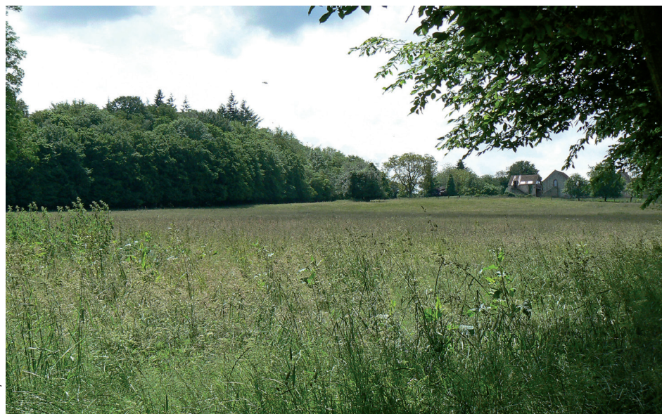
L'emplacement de l'ancien camp romain

A l'ouest du site, sur les hauteurs, des prairies maillées de haies bocagères, occupent les pentes les moins raides. On ne devine rien de l'ancien camp romain qui devait se situer dans le pré, devant la ferme du Camp cachée derrière un verger de pommiers. Le domaine de Blanchelande est un site fermé, encaissé et très peu accessible. En propriété privée et close, les étangs sont enchâssés dans la végétation des rives et des coteaux. Les routes qui le bordent sont longées de haies denses qui laissent peu de vues sur un site encore pittoresque mais difficile à appréhender.