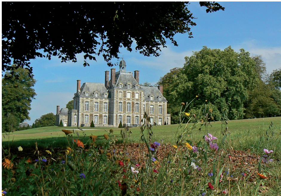
Le parc au sud-est du château

La commune de Balleroy se situe à l'ouest du département du Calvados, à 18 km au sud-ouest de Bayeux. Le château se trouve à l'ouest du bourg dans le prolongement de la rue du sapin.