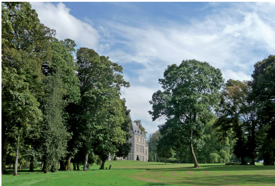
Le jardin anglais au nord du château

La grande perspective urbaine voulue par Jean de Choisy est toujours aussi belle. La longue avenue bordée d'arbres se resserre en bas, entre des murs, pour mieux guider l'œil vers le château, en point de fuite. Les abords de l'édifice n'ont subi que peu de transformations. Soignées et entretenues, les avant-cours s'étagent jusqu'au château qui repose sur son esplanade entourée de douves. Dans la cour des écuries, les parterres de broderies de Duchêne, sont magnifiques. Bien que récents, ils sont devenus indissociables du château tant l'icôneographie du XX e siècle les a représentés. Avec les écuries, dont l'une est transformée en musée des ballons, ils forment une merveilleuse antichambre avant la visite du monument. Sur la droite, les anciens potagers souffrent un peu d'abandon et nécessiteraient quelques travaux de restauration et de requalification paysagère. A l'ouest, devant le château, le grand parterre n'existe plus, remplacé par une pelouse ponctuée de deux vieux platanes remarquables. Au-delà, la grande prairie, utilisée en partie en pacage, offre de longues vues vers la vallée de la Drôme et la forêt de Cerisy. Vers le sud, le jardin anglais a subi d'importants dégâts. Le bosquet entre le château et les potagers, s'est éclairci ainsi que la bande boisée qui descend dans la vallée. De l'allée qui la traverse, de belles vues s'offrent vers le bourg qui s'étire le long de la rue des forges. La promenade dans le vallon est dé-