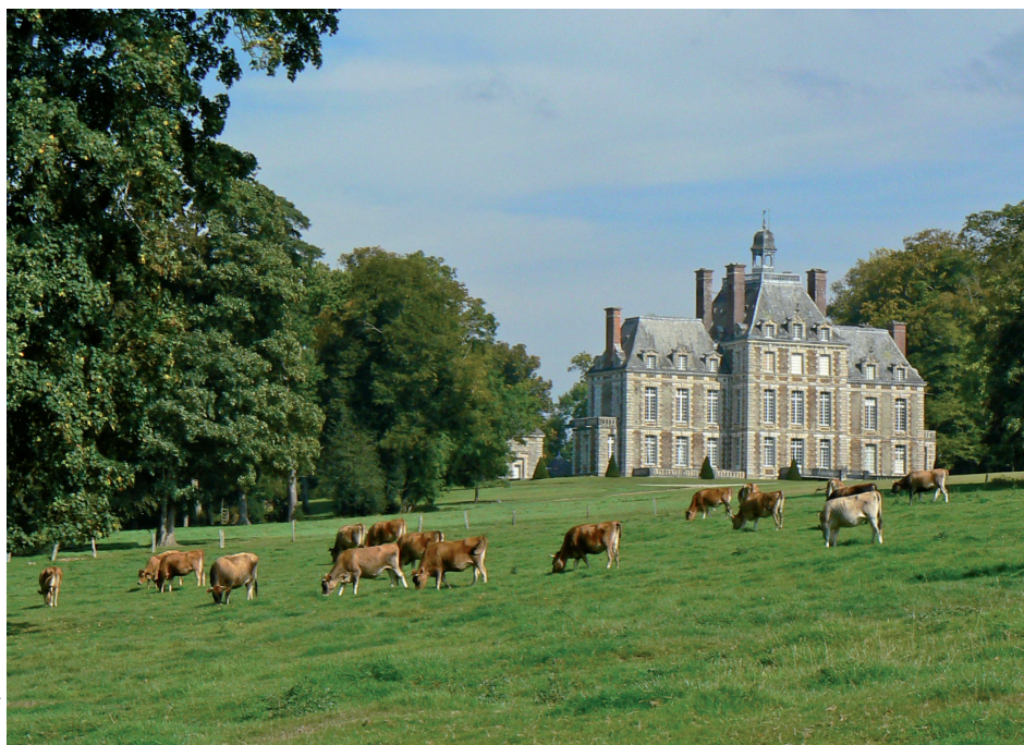
Prairie paturée dans le parc

par la tempête de 1999. Au nord-ouest, la grande prairie est ponctuée de bosquets de chênes et de hêtres. Espace de pacage, elle offre des vues étonnantes vers le château avec, en premier plan, des troupeaux de bovins qui paissent paisiblement. Au sud, le Grand Parc est toujours marqué par les allées qui le structurent. Les avenues du château, du Fer à Cheval et Quentin sont recoupées de trois transversales : avenues des Bons enfants, de la Ferme du parc et de Tivoli. Elles délimitent de vastes parcelles agricoles bordées d'arbres. Les alignements de hêtres ont été confortés sur toutes les avenues en conservant les sujets les plus robustes. Seule la très longue avenue Quentin, fond de scène du parc, a été traitée de façon différente avec ses deux doubles alignements de frênes. Au-delà, vers le sud, les abords de la ferme du Parc sont plantés de jeunes vergers de pommiers à haute tige. A l'ouest du site, le belvédère sur la vallée de la Drôme n'est plus qu'un souvenir. Une longue bande boisée occulte désormais les vues sur la rivière, depuis le fer à cheval. Au sud du château, les bosquets, autrefois aménagés, sont en cours de restauration, les sous-bois sont nettoyés et le tracé des anciennes allées est réapparu. Un projet conduit par le service des Monuments Historiques vise à restituer le bosquet sud dans ses dispositions d'origine.