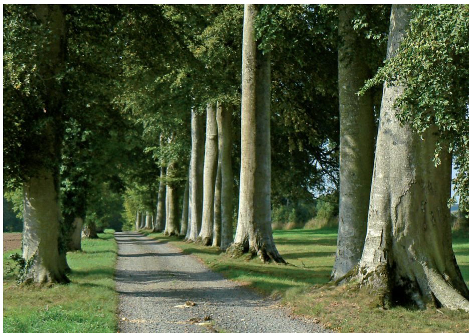
L'allée de Tivoli et ses hêtres

Sources : Etude Bosquet Sud – Daniel Lefevre, architecte en chef des MH – 2001 Projet d'aménagement paysager - DIREN- Damée, Vallée associés - 2002