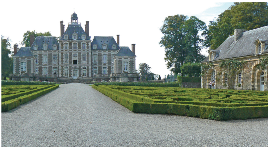
Parterres de broderies devant les écuries