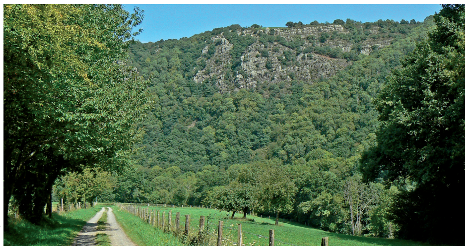
Les rochers de la Houle vus de Cantepie

Les hautes falaises rocheuses verticales et boisées sont peu propices à l'implantation d'équipements touristiques et le site semble à l'abri de toute menace. Les paysages alentours sont inscrits dans le grand site de la vallée de l'Orne (voir site 14085). Depuis 2007, ils ont intégrés les Espaces Naturels Sensibles du Département du Calvados. En 2010, une Zone Spéciale de Conservation « Site Natura 2000 Vallée de l'Orne et ses affluents » est désignée, englobant les rochers de la Houle. Le Conseil général du Calvados réalise l'acquisition, l'aménagement et la gestion du site en vue de sa préservation, de sa valorisation et de son ouverture au public.