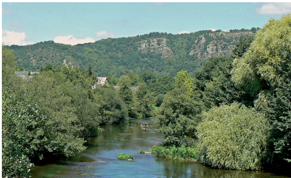
L'Orne et les rochers de la Houle vus du pont du Vey