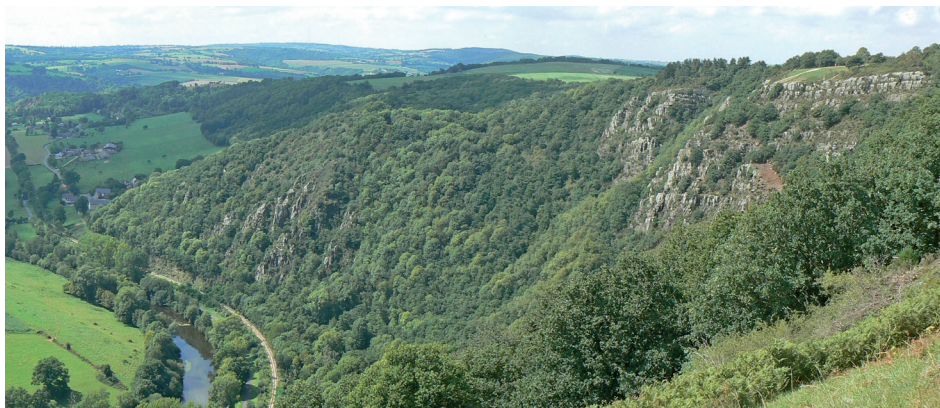
Le Pain de Sucre vu de la route des crêtes

Au cœur d'un des paysages les plus emblématiques de la Normandie, les rochers de la Houle sont un des lieux renommés de la Suisse Normande, avec notamment le Pain de sucre, qui a concouru à sa notoriété. En rive droite, les hautes parois