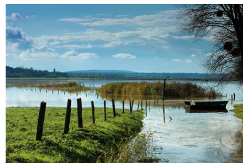
Marais blanc Carquebut

Les vallées de l'Aure, l'Ay, la Douve, la Taute, la Vire, ainsi que les Marais de la côte Est abritent une grande diversité d'habitats naturels. Parmi les plus remarquables, on peut distinguer : les prairies tourbeuses, les fossés et cours d'eau. Profondeur et types de tourbe, pratiques agricoles et niveaux d'eau sont les trois principaux facteurs influençant la répartition de la végétation. Leurs variations génèrent une extraordinaire biodiversité qui place les marais du Cotentin et du Bessin parmi les plus riches zones humides de France.