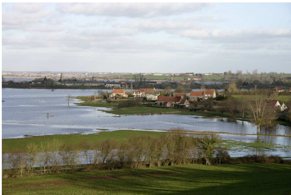
Marais de Graignes