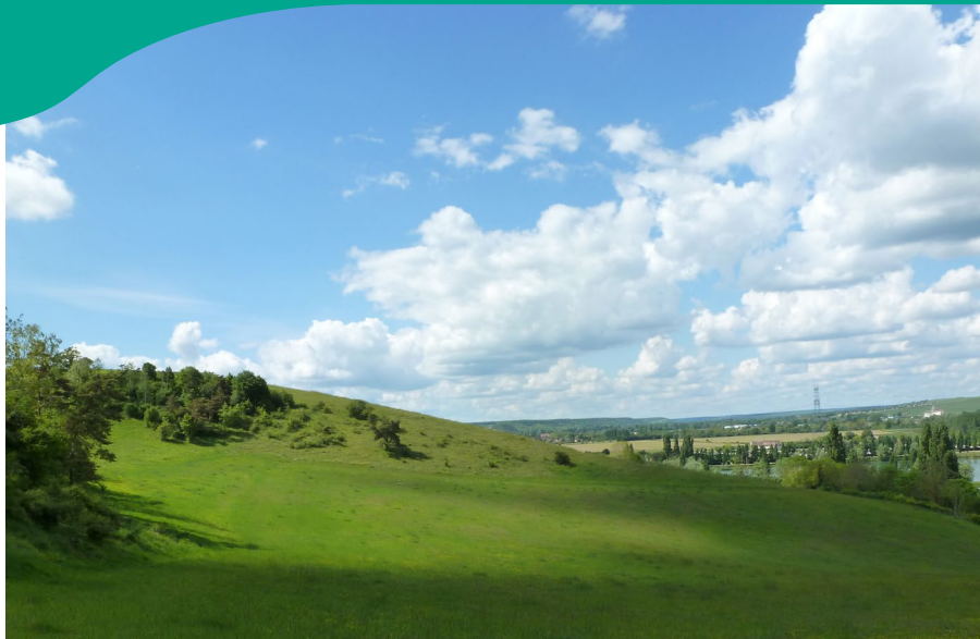
Paysage de la Vallée de l'Eure

Acquigny, Ailly, Amfreville-sur-Iton, Autheuil-Anthouillet, Boisset-les-Prévanches, Boncourt, Brosville, Caillouet-Orgeville, Cailly-sur-Eure, Canappeville, Chambray, Clef Vallée d'Eure, Croisy-sur-Eure, Croth, Epieds, Evreux, Ezy-sur-Eure, Fains, Fontaine-sous-Jouy, Gadencourt, Garennes-sur-Eure, Hardencourt-Cocherel, Heudreville-sur-Eure, Hondouville, Houetteville, Houlbec-Cocherel, Irreville, Ivry-La-Bataille, Jouy-sur-Eure, La Haye-Le-Comte, La Vacherie, Le Boulay-Morin, Le Cormier, Le Mesnil-Jourdain,