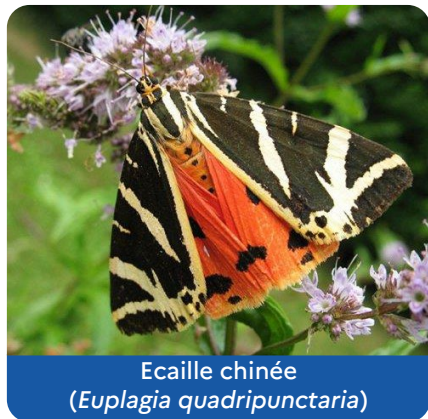
Ecaille chinée ( Euplagia quadripunctaria )