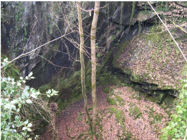
Détail du front de taille