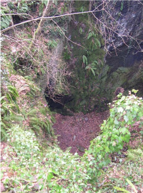
Vue prise du sommet du puits d'extraction