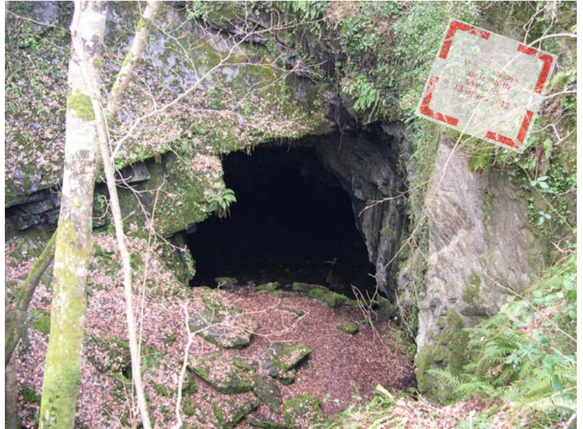
Entrée de l'excavation souterraine