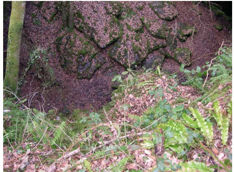
Ardoises débitées restées sur place