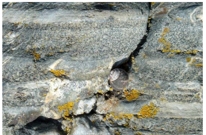
Cordiérite dans les lits silteux du Briovérien - Sol Roc