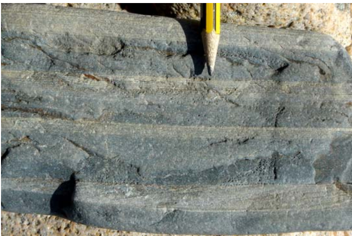
Structures sédimentaires préservées dans les cornéennes à cordiérite - Port du Lude