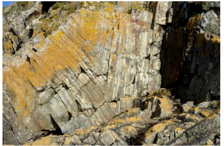
Pli cadomien en chevron dans la falaise - Nord de Port du Lude