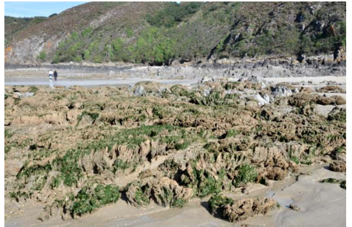
Biohermes à hermines près de la cale de Sol Roc