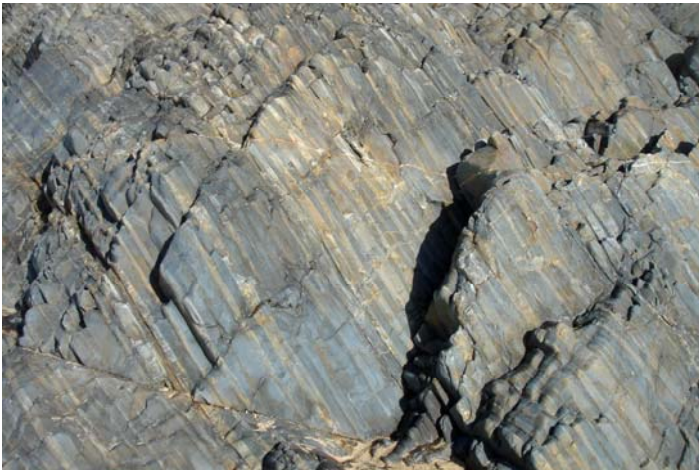
Cornéennes rubanées, issues du thermométamorphisme du flysch briovérien - Pointe de Carolles