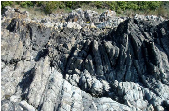
Plis cadomiens métriques en chevrons - platier de Sol Roc