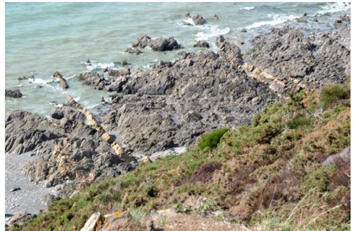
Filons d'aplite dans le platier rocheux vus depuis le sentier littoral - la Cabane Vauban