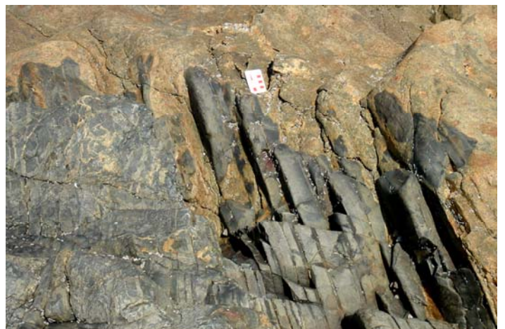
Contact granite-cornéennes sur le platier - Port du Lude