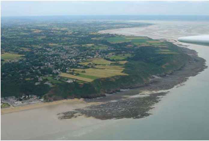
Vue aérienne vers le Sud avec, au premier plan, la pointe de Carolles, puis le débouché du Lude et, en arrière plan, la baie du Mont-St-Michel