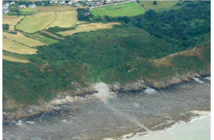
Vallée du Lude barrée par un cordon de galets - Port du Lude