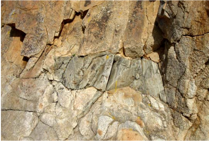
Enclave de cornéenne dans la granodiorite - Port du Lude