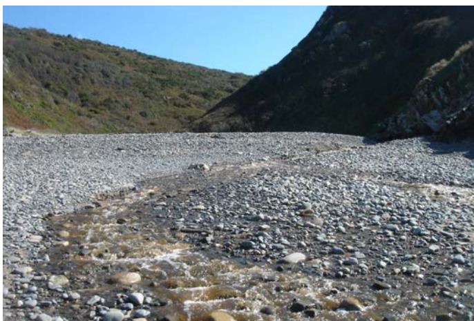
Cordon littoral de galets - Port du Lude