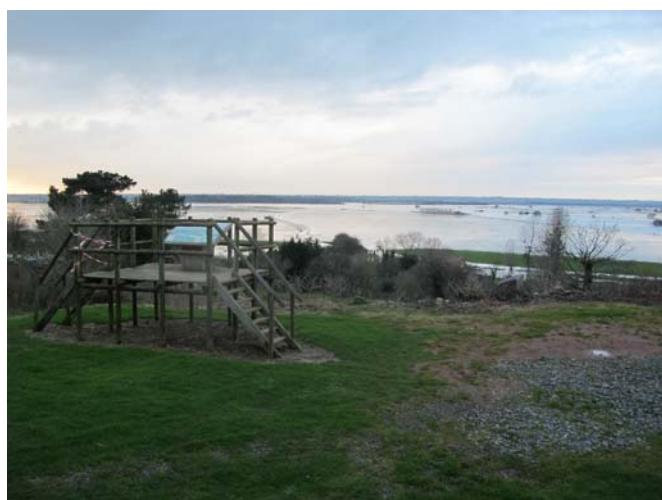
Point d'observation aménagé sur le promontoire de Graignes