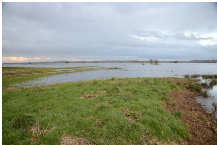
Partie nord-ouest des marais de Carentan, près du lieu-dit Ferme du Bois