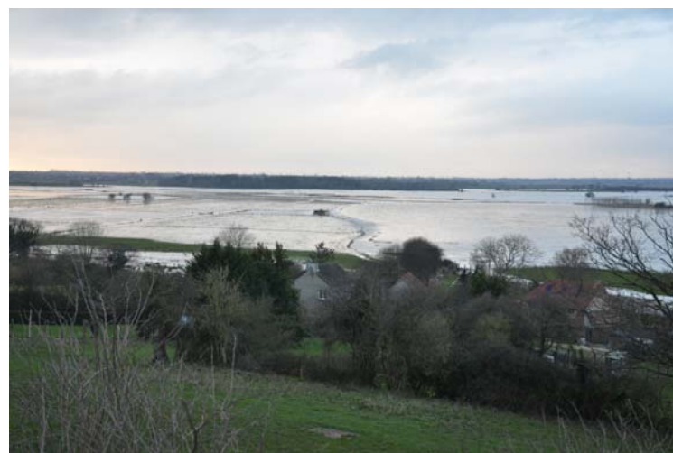
Vue vers l'Ouest depuis le promontoire de Graignes sur les marais blancs de Carentan