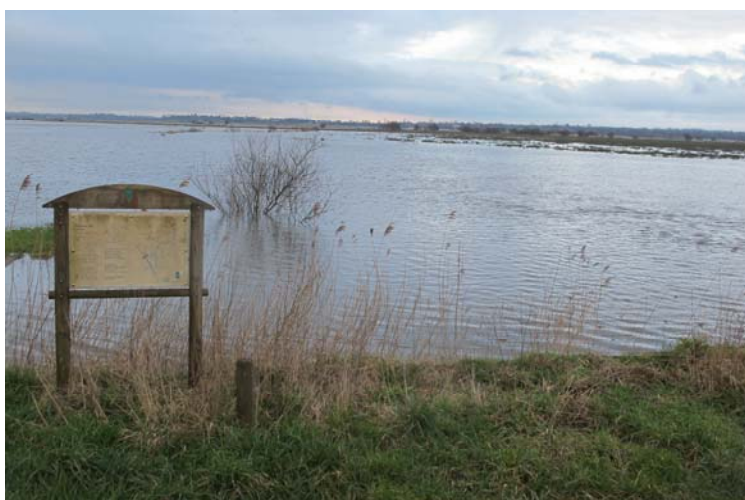
Marais de Carentan vus depuis la D29, au lieu-dit le Port