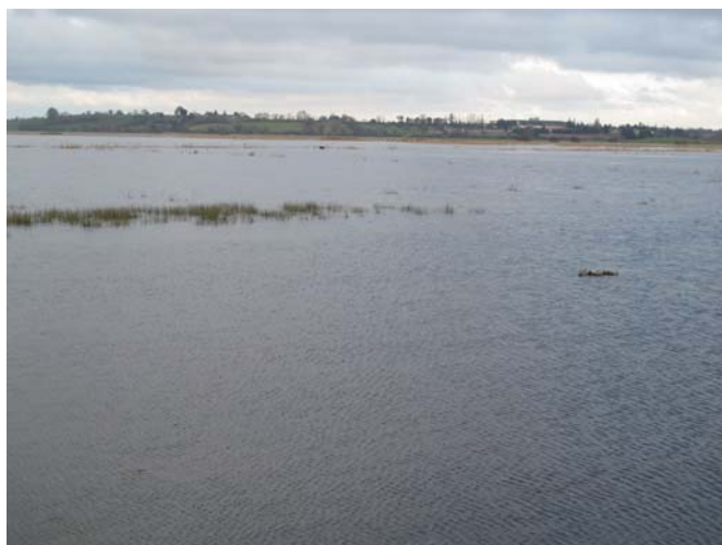
Le promontoire de Graignes vue depuis la Ferme du Bois