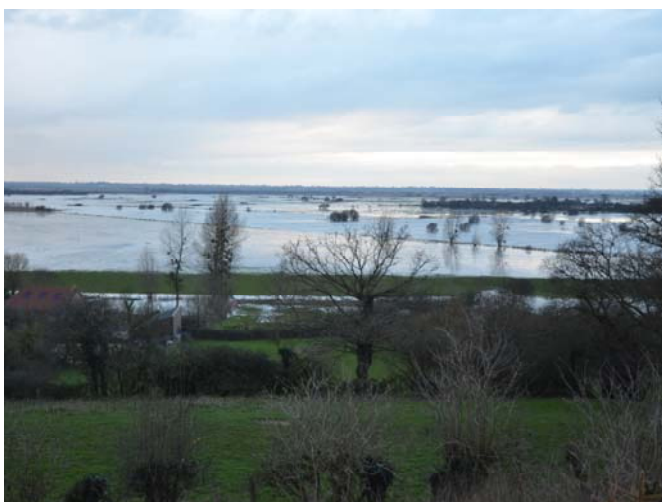
Vue vers le Nord-Ouest depuis le promontoire de Graignes sur les marais blancs de Carentan