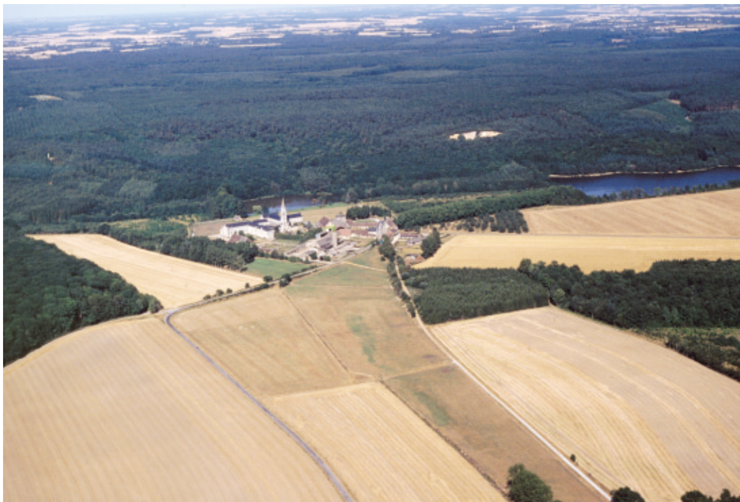
Ci-dessus : En lisière de la forêt de la Trappe, se niche la célèbre abbaye.