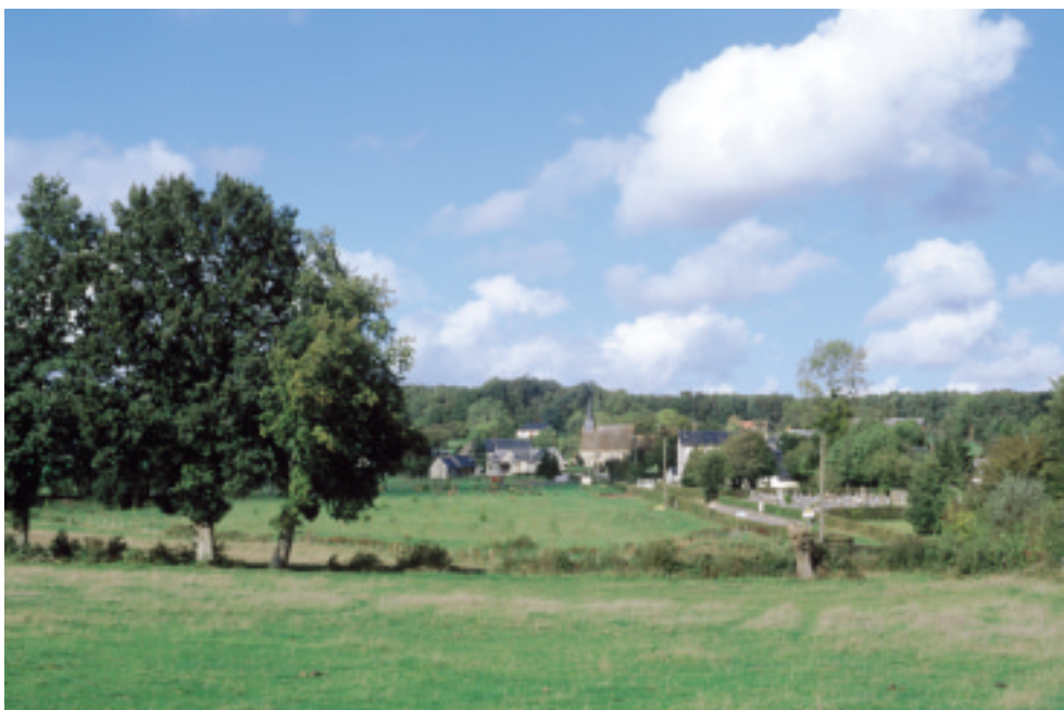
Ci-contre : Saint-Pierre-des-Loges.

La fragilité des lisières est également un enjeu essentiel : la qualité paysagère repose souvent sur le rapport subtil entre masses boisées et espace ouvert qui crée des micro-paysages en écrin. Il existe un risque réel de fermeture et d'opacification de ces lisières.