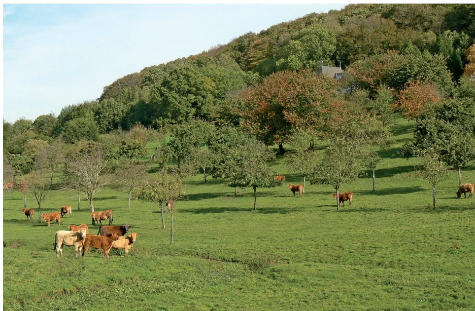
Le vallon de la Michelière

La commune de Honfleur se situe sur le littoral à l'est du département du Calvados, dans l'estuaire de la Seine. Le site se trouve entre la route de Trouville (D 513), le chemin du Vallon et le chemin des Bruyères sur l'ancienne commune de Vasouy (associée à Honfleur en 1973), à 2,5 km à l'ouest de la vieille ville.