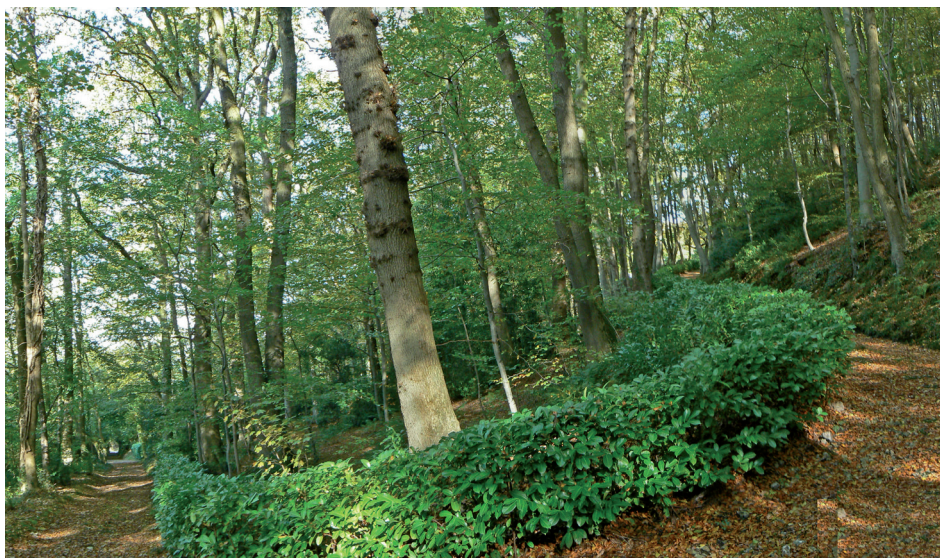
Chemin vers le château de la Roche-Vasouy

Si les parties du site situées au nord de la route de Trouville (vers la mer) ne sont pas dépourvues de qualités paysagères, elles ne se distinguent pas particulièrement des terrains qui l'entourent et sont simplement inscrits. Le vallon de la rivière de Vasouy et la colline boisée qui le domine sont particulièrement remarquables et le propriétaire de la Michelière entretient avec soin le cadre naturel de la villa (plantations récentes de pommiers dans le vallon). La colline boisée du Haut butin est un élément essentiel du paysage à l'entrée d'Honfleur. Son versant ouest se tourne ensuite vers le nord pour envelopper de verdure tout le