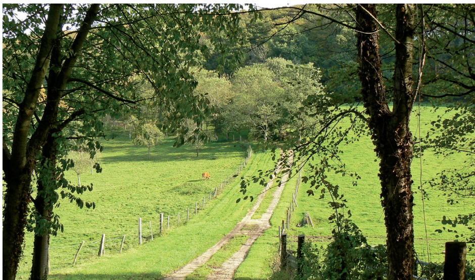
Voie communale de la Michelière

de la villa émergent des arbres. Le site s'étend vers le sud-est, jusqu'au chemin des Bruyères où le manoir du parc est invisible dans les bois qui l'entourent. L'accès à la Michelière s'effectue sur la route de Trouville, en face du Clos Saint-Nicolas (en partie classé). Des haies sur talus encadrent un chemin creux pour former un véritable tunnel de verdure. Sur la gauche, une étroite bande de terrain (classée) est envahie de ronces et de fougères. Le chemin bifurque près de la Michelière pour grimper vers le chemin des Bruyères. Le sentier, bordé d'une haie basse de lauriers, traverse un bois de chênes et hêtres bien entretenu où quelques beaux sujets demeurent. A travers les grands arbres, quelques vues apparaissent sur l'estuaire de la Seine et le port du Havre.