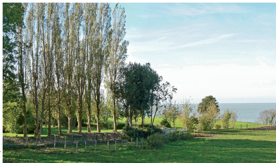
Vallon près du Clos Joli