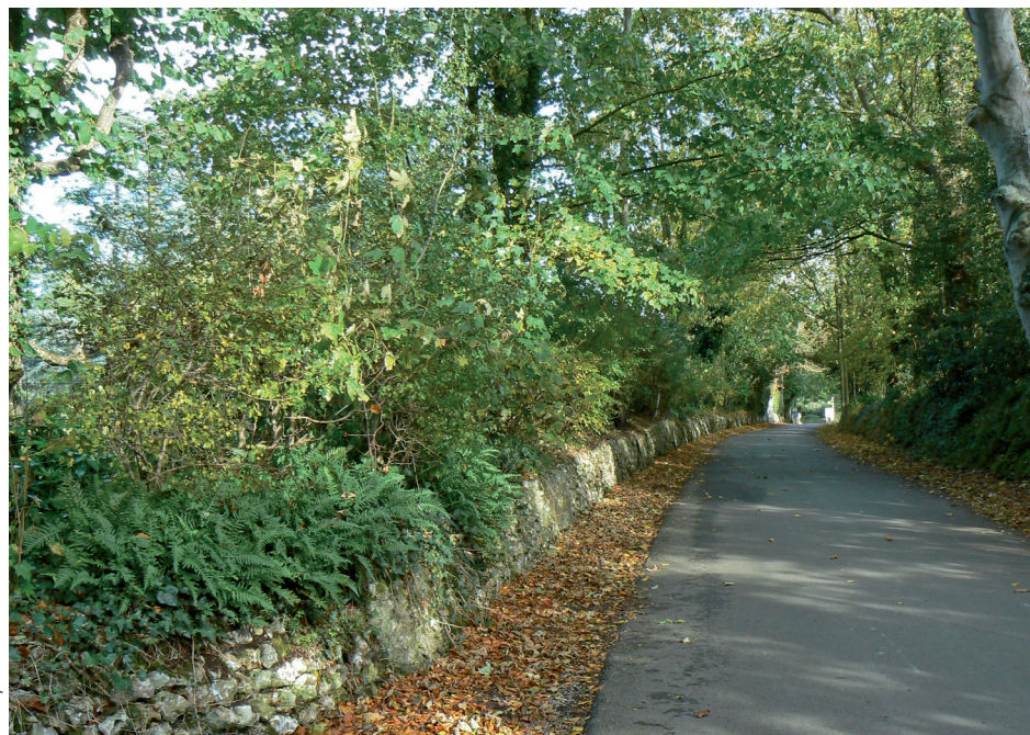
Le chemin des Bruyères au sud du site