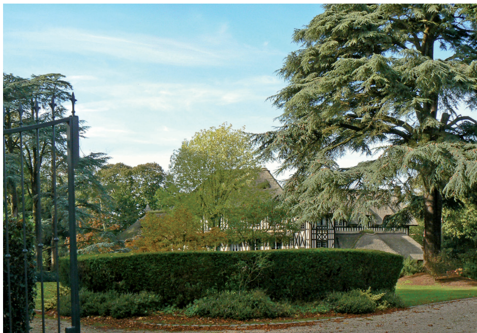
La résidence des « Bois d'Arkel »

La commune d'Equemeauville se situe à 3 km au sud-ouest de Honfleur. Le domaine du Bois Normand se trouve sur le plateau de Grâce, le long du chemin des Bruyères (D 62), près du Haut Butin.