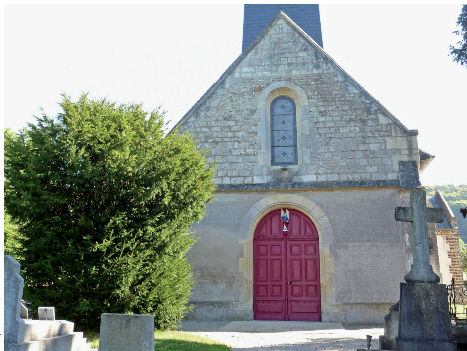
Le portail occidental et le jeune if

belles vues sur les versants boisés proches dont le bois des Parcs-Fontaines (site classé 14026) et sur les prairies qui s'étendent en dessous.