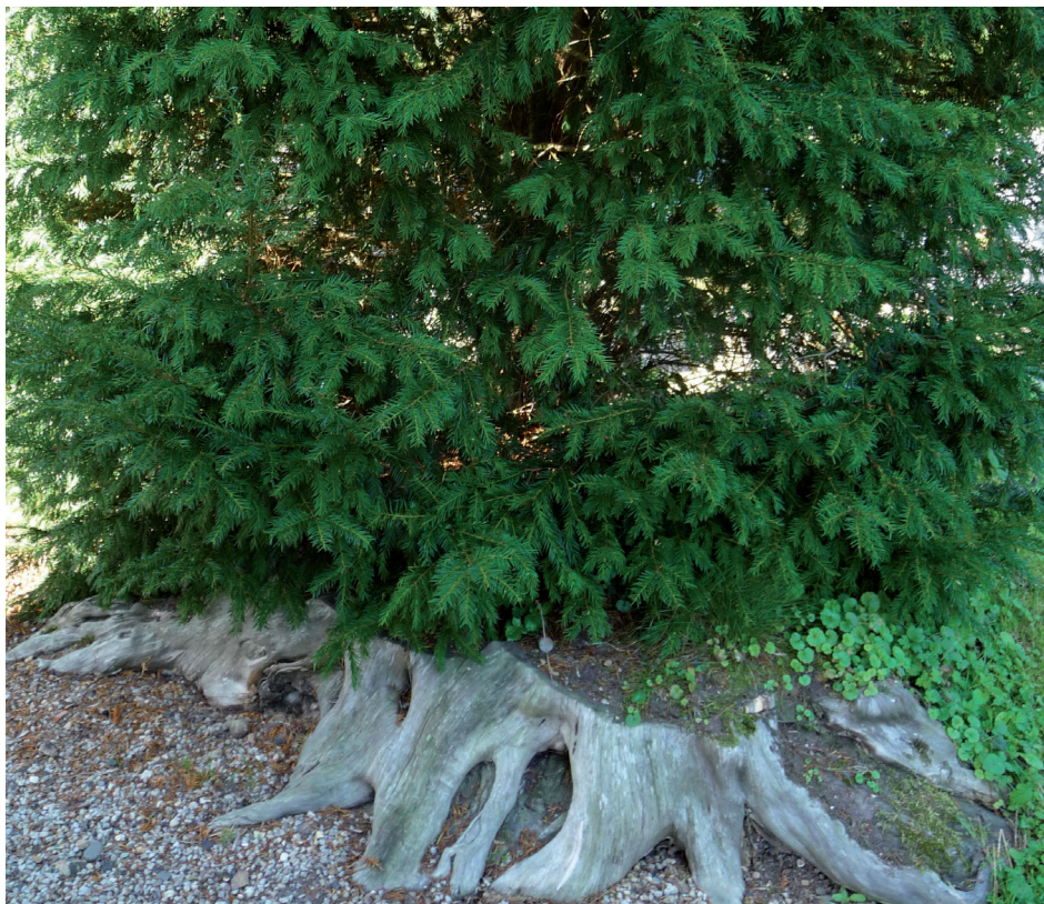
Le jeune if planté dans la souche de l'ancien

En face de la mairie à colombages, on accède au cimetière par un petit portillon de bois rouge « sang de boeuf » qui s'ouvre, près du chœur de l'église, dans une haie basse taillée de charmille. L'église, petite construction XVIII e en pierre, toute simple à nef unique, est couverte d'ardoises. Au-dessus du portail occidental, s'élève un clocheton à base carrée et à flèche octogonale essentée d'ardoises et percée d'abat-sons. Des allées gravillonnées cernent les sépultures, au-delà le sol engazonné est soigneusement entretenu. A droite, une haie de noisetiers est élaguée en partie basse. Les deux autres cotés sont fermés par une haie basse taillée de lauriers palmés. Les deux ifs se trouvent de part et d'autre du portail occidental. A gauche, seule la souche de l'if classé demeure, elle mesure près de 7 m de circonférence ; en son centre, est planté un jeune if, resplendissant de santé, de près de 4 m de haut. L'if de droite est un bel arbre, plusieurs fois centenaire, de près de 20 m de haut et au tronc puissant et cannelé. Entretenu, il paraît en bon état malgré la suppression de quelques charpentières du côté de l'église entraînant un porte à faux important vers la haie proche. A l'extérieur de l'enclos, deux autres ifs, plus jeunes, s'élèvent en limite séparative sud-ouest. Cet endroit offre de