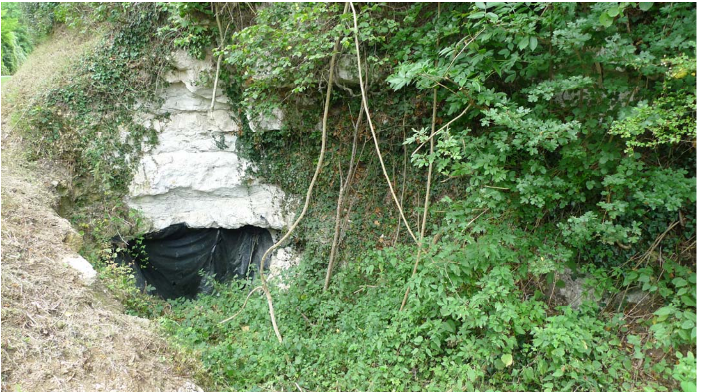
Vue rapprochée de l'affleurement surmontant l'entrée de la carrière souterraine