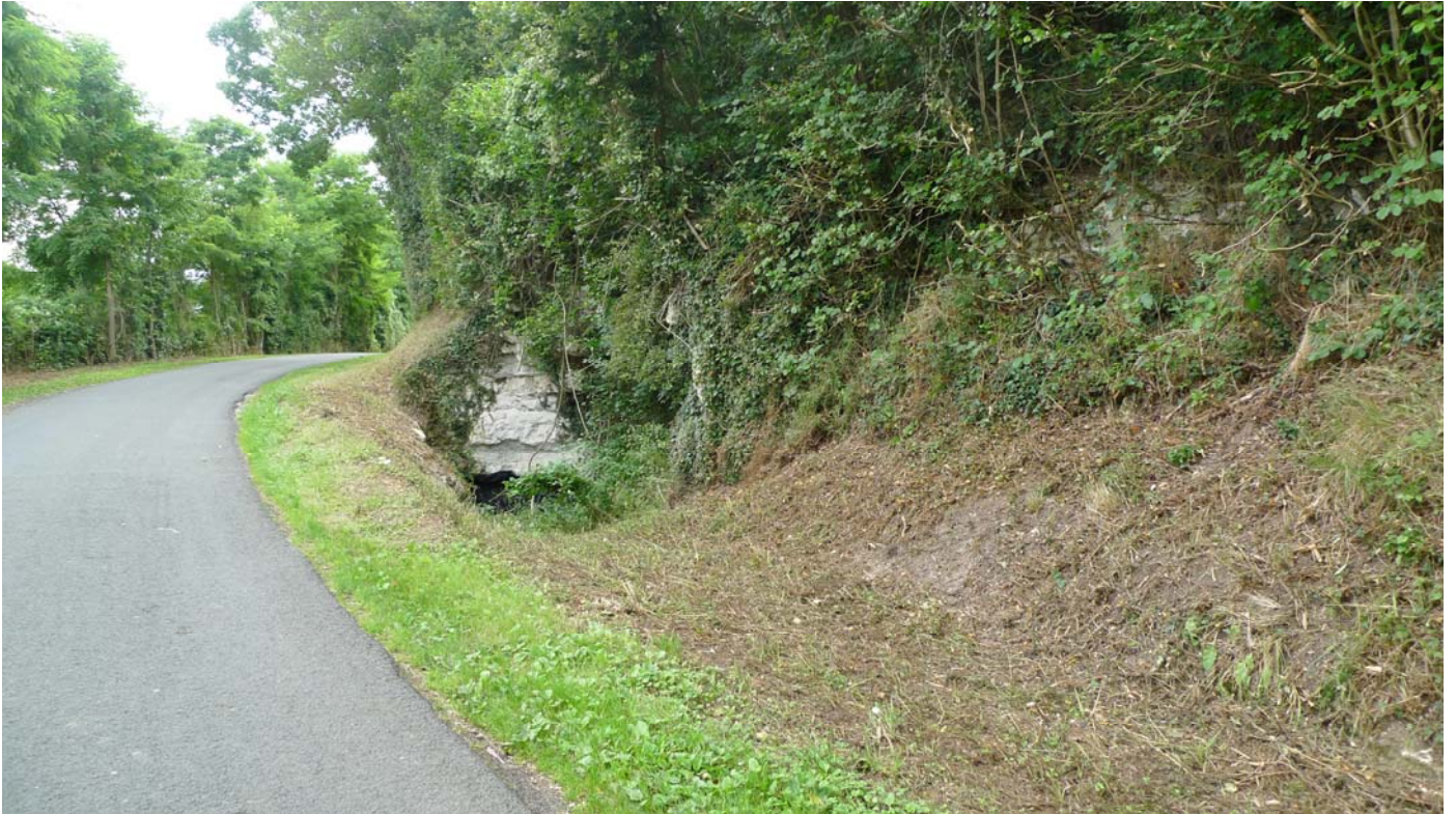
Vue d'ensemble du site